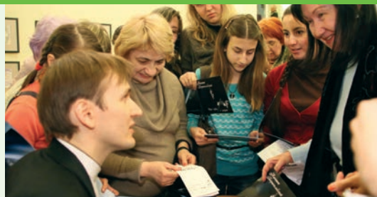
«Звезды XXI века» и поклонницы