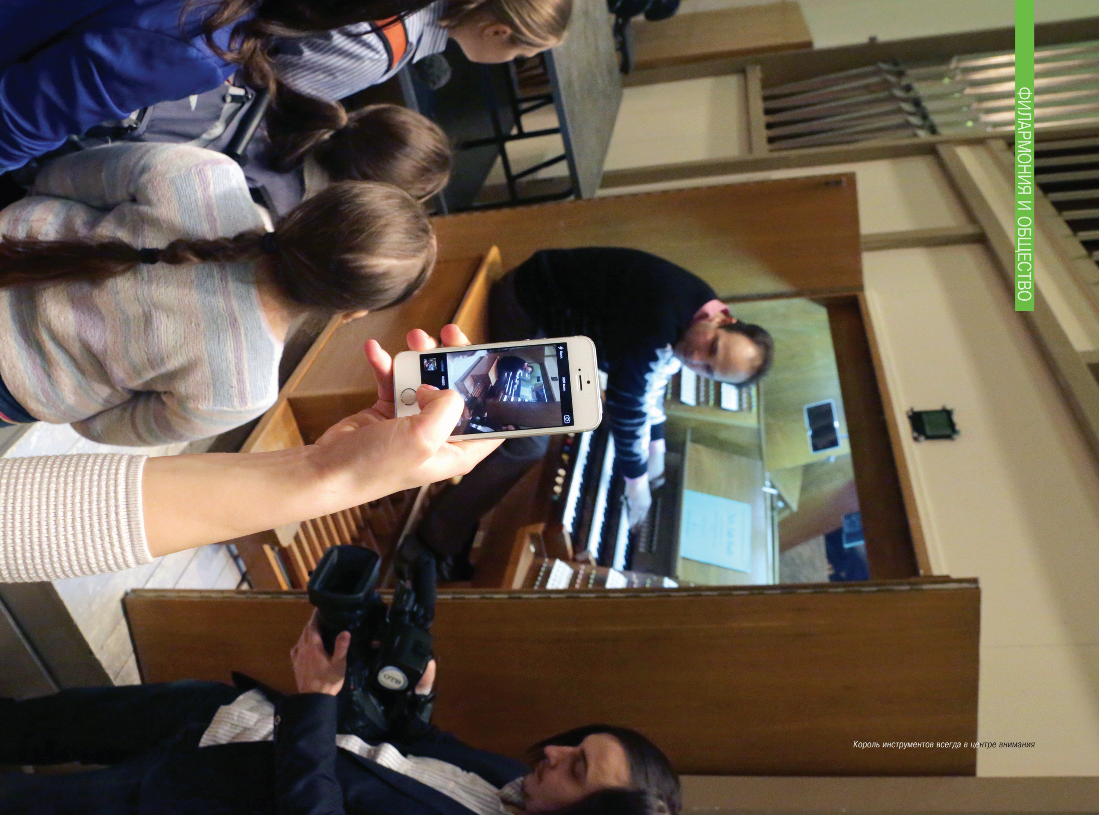
Король инструментов всегда в центре внимания