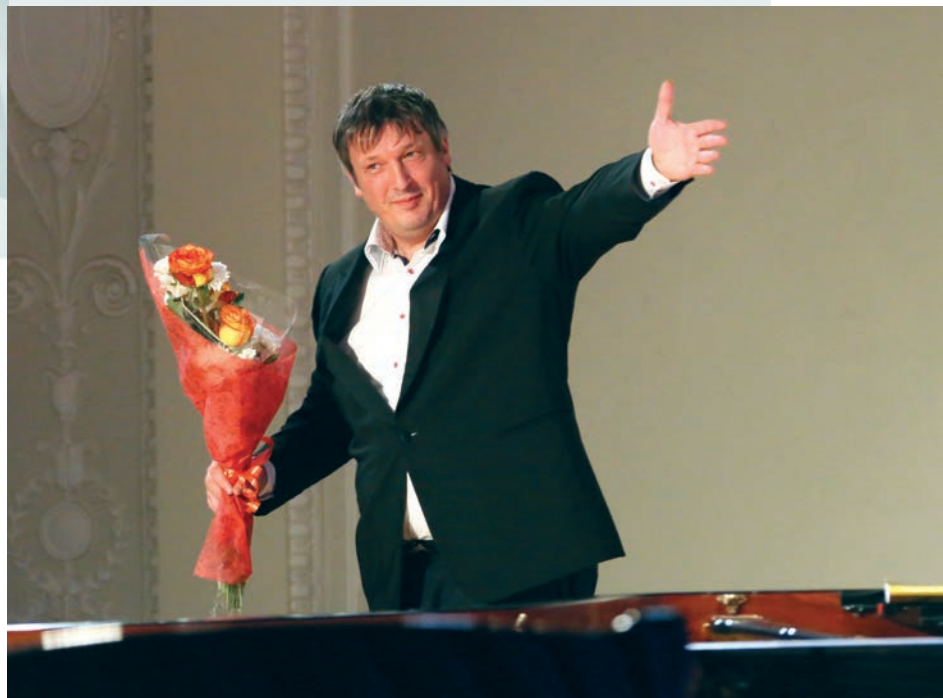
Борис Березовский представляет