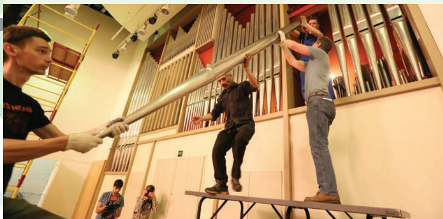
Такое бывает раз в сорок лет

В августе и сентябре 2014 года проведены масштабные реконструкция и модернизация инструмента, стоимость которых обеспечили средства из бюджета Свердловской области и благотворительная акция «Сохраним орган» (1.02.2013 – 30.10.2014), состоявшаяся благодаря поддержке Лиги друзей филармонии.