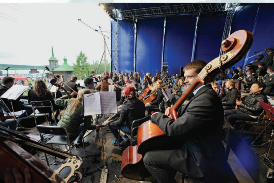
Оркестр в честь именин П.И. Чайковского