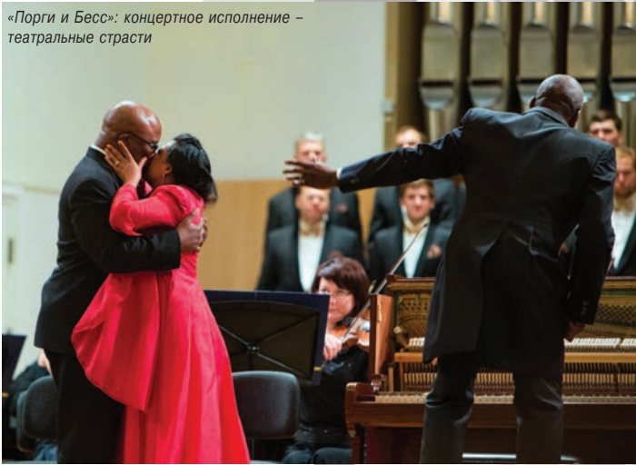
«Порги и Бесс»: концертное исполнение – театральные страсти