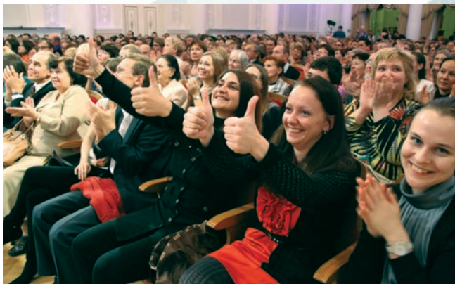
Премьеры на «ура»!

Viktorova O. Ashes and Diamonds , for marimba. P. Glavatskikh. October 2