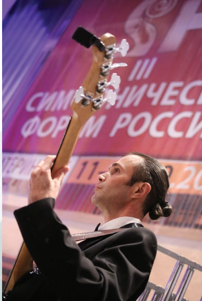
«Щелкунчик» на бас-гитаре