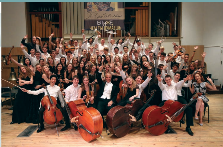
Международный Чайковский-оркестр. Музыка сближает!

– Общение – это важная часть постижения мира, открытие новых горизонтов и расширение кругозора. Сквозь призму взгляда на «чужую» культуру начинаешь по-новому оценивать «свою». Это так необходимая сейчас попытка научиться понимать друг друга, иметь самостоятельное мнение при ответах на важнейшие вопросы, стоящие перед нами сегодня.