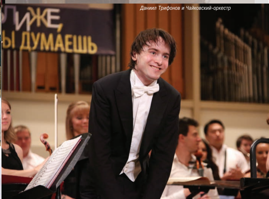
Даниил Трифонов и Чайковский-оркестр