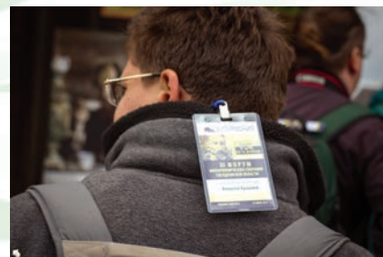
В сетях и в офф-лайне

Количество посетителей основного сайта филармонии www.sgaf.ru за 2014 год составило 107 380 человек (227 752 визитов) и 10 857 броней билетов, т. е. в среднем 294 человека и 29 подтвержденных заказов в день. Каждый 20-й визит завершается бронью на сайте.