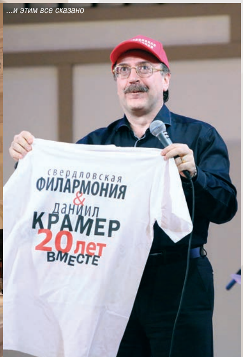
...и ЭТИМ все сказано