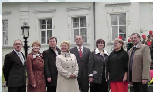
День рождения П.И. Чайковского. Алапаевск

6 ноября , день памяти композитора, стал Днем музыки Чайковского в Свердловской области. В рамках акции прошло более 50 концертов и 300 мероприятий. Музыка композитора звучала даже во время хоккейного матча.