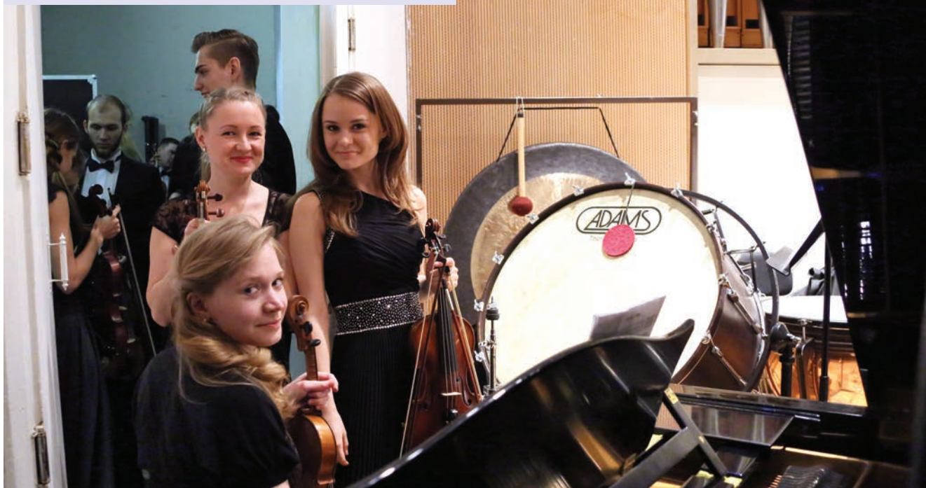
За минуту до концерта

Создан в 2007 году. Сочетает образовательную функцию и концертную практику. Ежегодно выступает более чем в 30 концертах, представляя на суд публики свыше 20 программ. Имеет серьезный гастрольный и фестивальный опыт (включая «Young Euro Classic» в Берлине). В составе – студенты музыкальных учреждений. Их повседневная жизнь – мастер-классы, репетиции и концерты с выдающимися дирижерами и солистами, изучение традиций исполнения классических и современных сочинений.