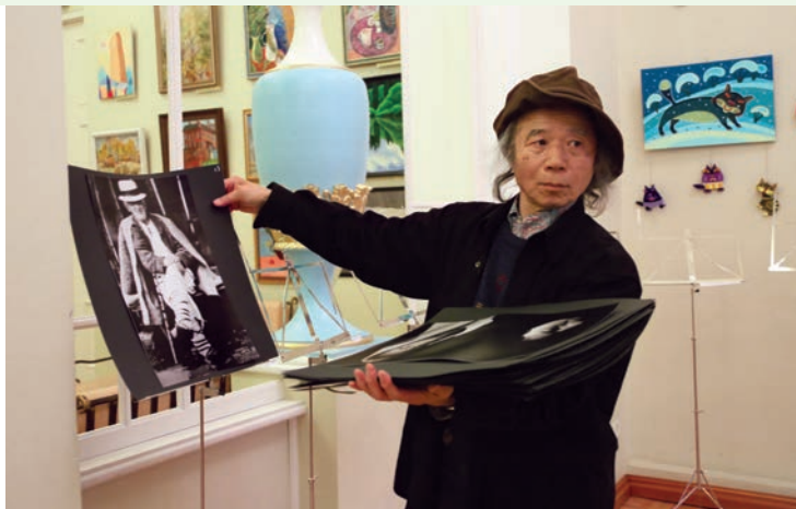
Японец, влюбленный в Румынию