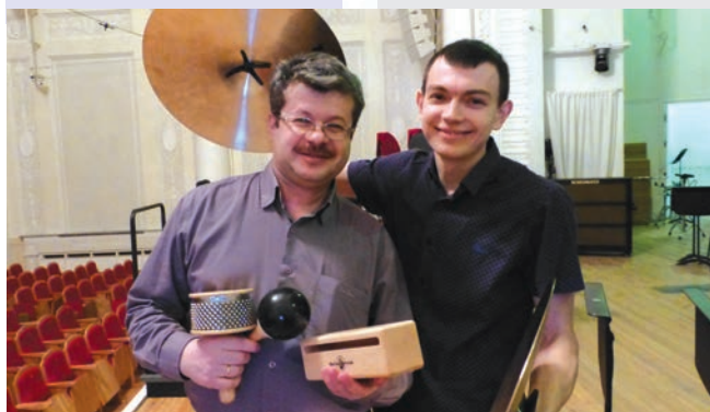
Главные по тарелочкам