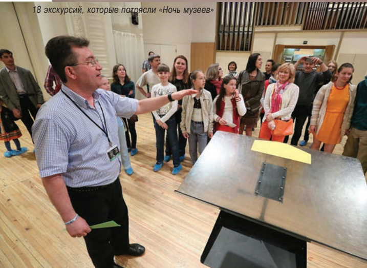
18 экскурсий, которые потрясли «Ночь музеев»