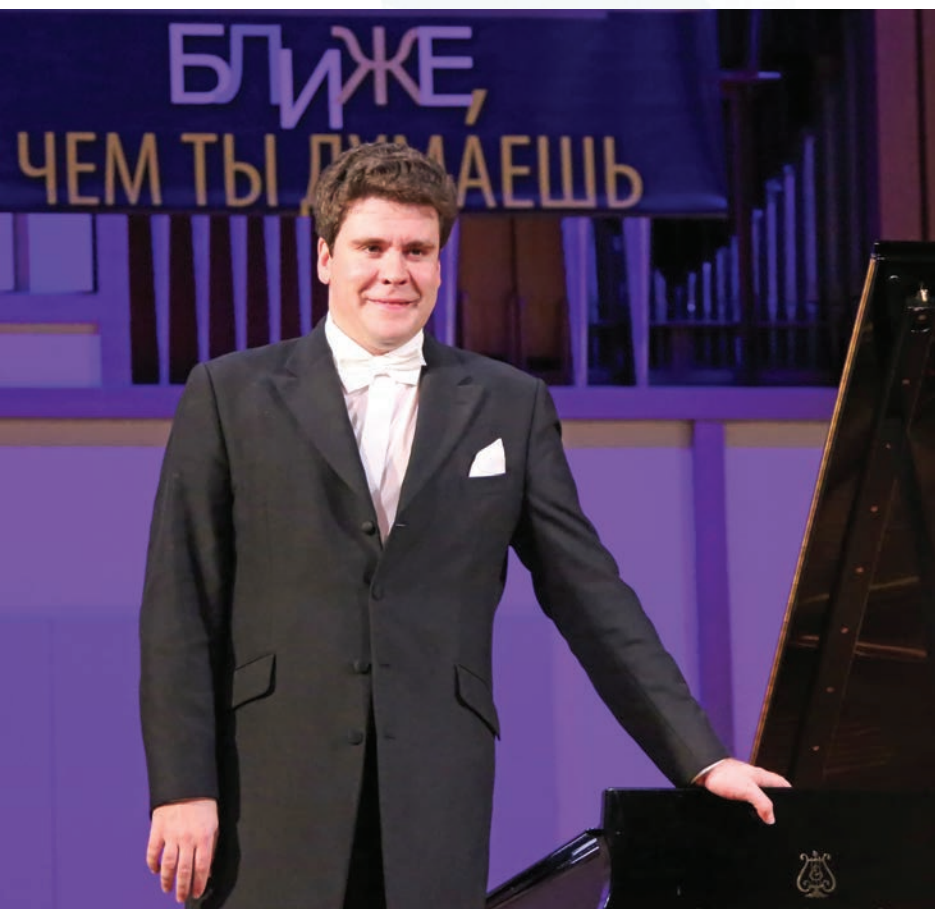
Денис Мацуев: «Чайковский ближе, чем ты думаешь»