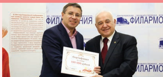
Не хлебом единым!