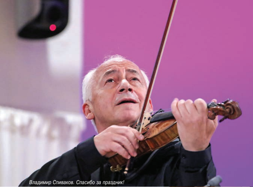
Владимир Спиваков. Спасибо за праздник!