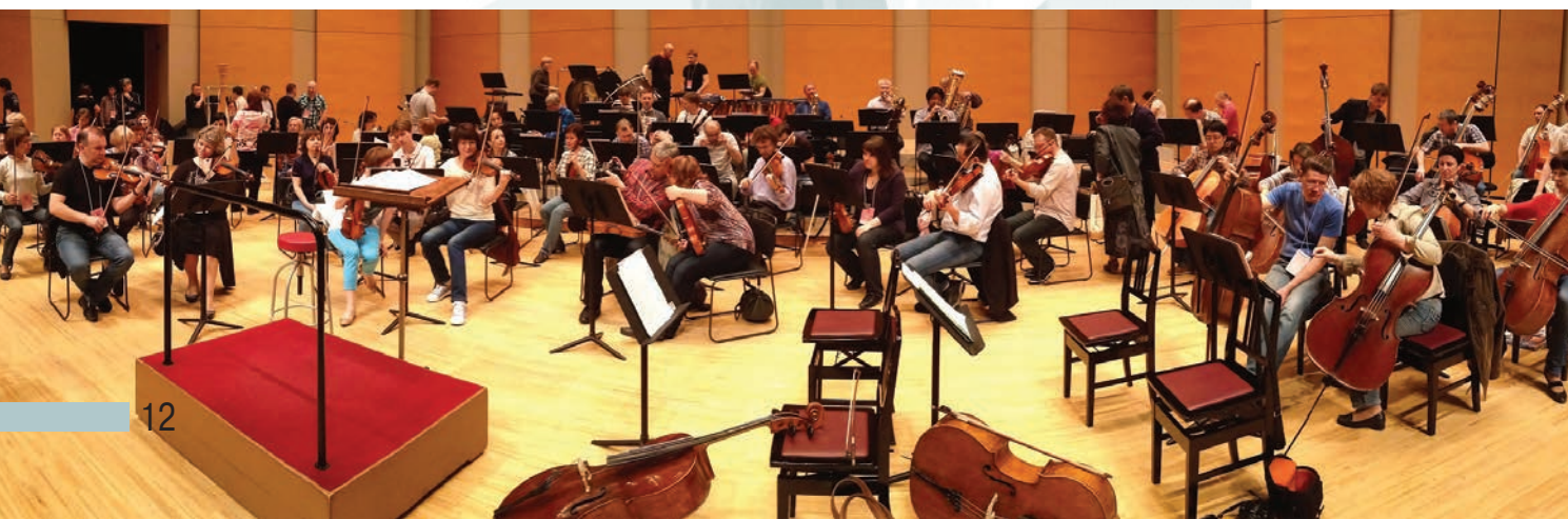
Музыка для Токио