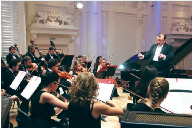
Посвящение Светланову. УМСО и маэстро Энхэ

Такемицу Т. «Семейное древо» для чтеца с оркестром. УАФО / Д. Лисс, чтец О. Крючкова. 19 января