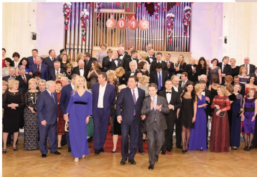
XXI Губернаторский благотворительный бал