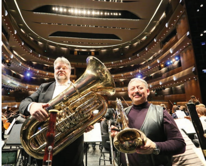
Во всем блеске на сцене Мариинки-2