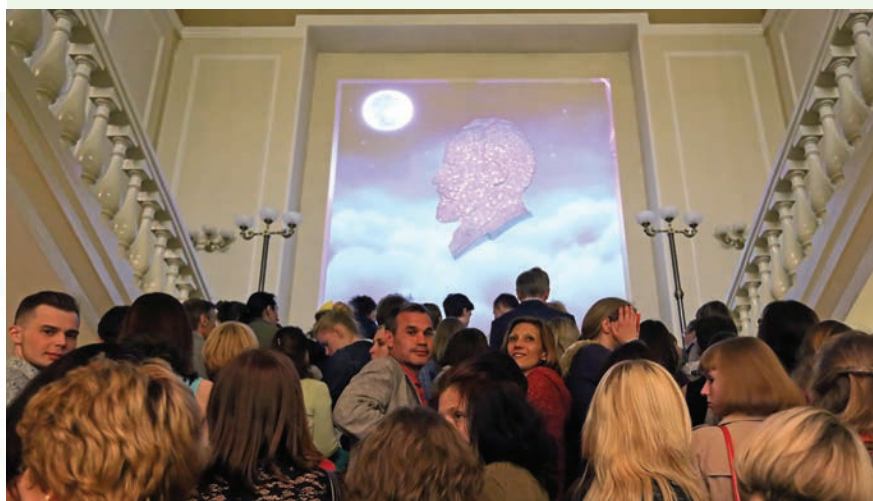
Ночь в филармонии

С 17 на 18 мая Свердловская филармония впервые приняла участие в проекте «Ночь музеев». Экспонатами стали художественные выставки, живописные фрески, барельефы, само здание – памятник архитектуры, которому в 2015 году исполнится сто лет, и музыкальные инструменты: орган, клавишин, арфа, челеста, группа ударных. 18 экскурсий посетили 1 200 человек, среди них – представители прессы и группа дипломатов.