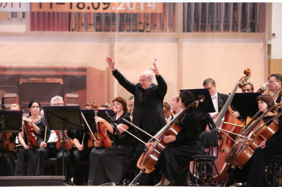
Эльяху Инбал – «Титан» и «Юпитер»