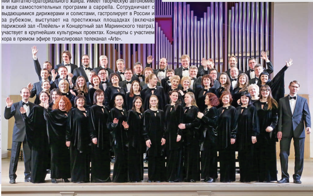
Симфонический хор в прекрасной форме

The choir works with outstanding conductors and soloists; it gives performances in Russia and other countries, gives concerts in prestigious concert halls (La Salle Pleyel is one of them), takes part in significant culture projects. The concerts with participation of the choir were broadcast live by the Arte TV channel.