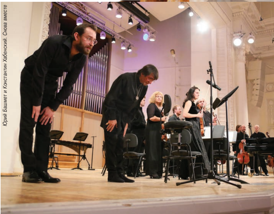
Юрий Башмет и Константин Хабенский. Снова вместе