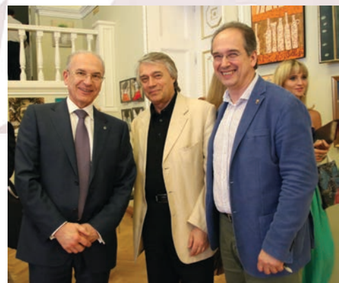
Фестиваль П.И. Чайковского