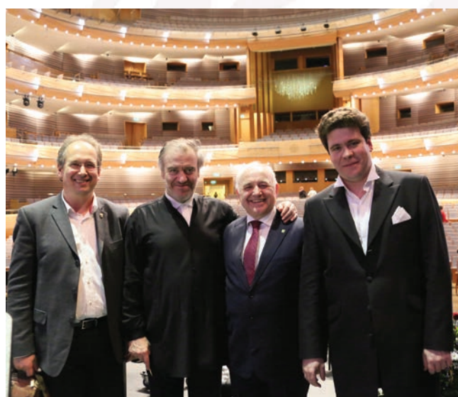
Большие друзья Большого оркестра