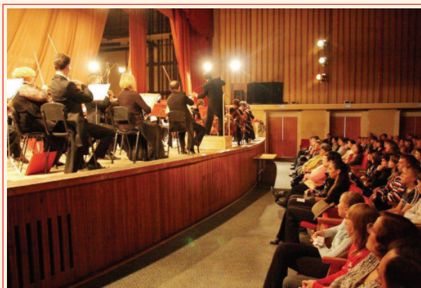
В Асбесте – аншлаги!