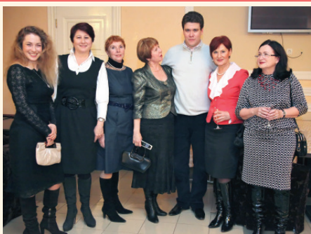
Дамский клуб в надежных руках

Члены клуба неизменно участвуют в реализации просветительских музыкальных программ в детских домах и интернатах Свердловской области совместно с постоянным партнером филармонии в этой деятельности – Благотворительным фондом «Синара».