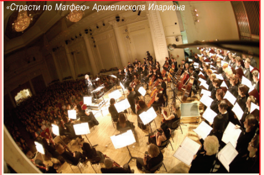
«Страсти по Матфею» Архиепископа Илариона