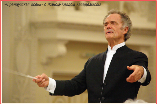
«Французская осень» с Жаном-Клодом Казадезюсом