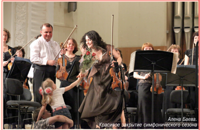
Алена Баева. Красивое закрытие симфонического сезона