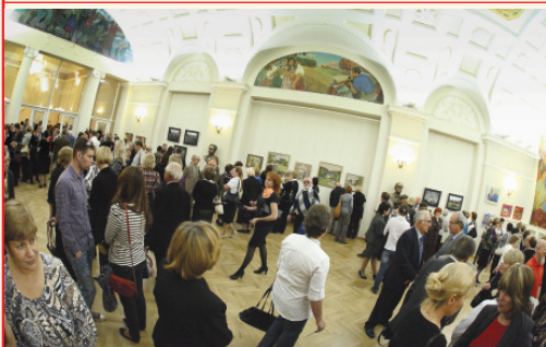
«Pas-de-deux» в Большом фойе

Создана в 2001 году. Располагается в Большом и Малом фойе, Клубном и Камерном залах филармонии. Сотрудничает с известными художниками и представляет новых авторов. Регулярно меняющиеся экспозиции предназначены в первую очередь для посетителей концертных залов филармонии, но стали заметной частью художественной жизни Екатеринбурга.