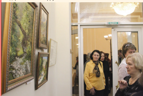
Полотна Галины Аксеновой – для взыскательной публики