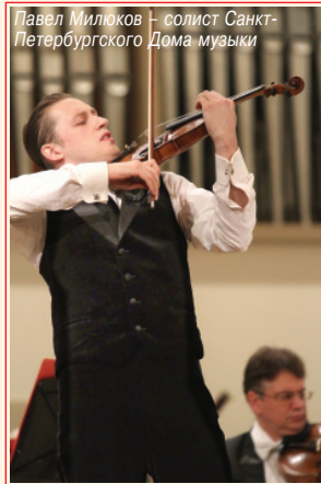
Павел Милуков – солист Санкт-Петербургского Дома музыки