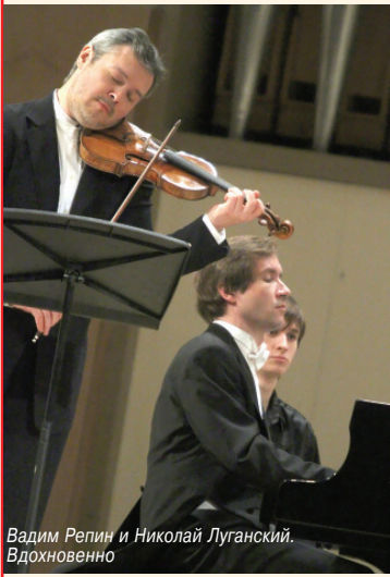
Вадим Репин и Николай Луганский. Вдохновенно