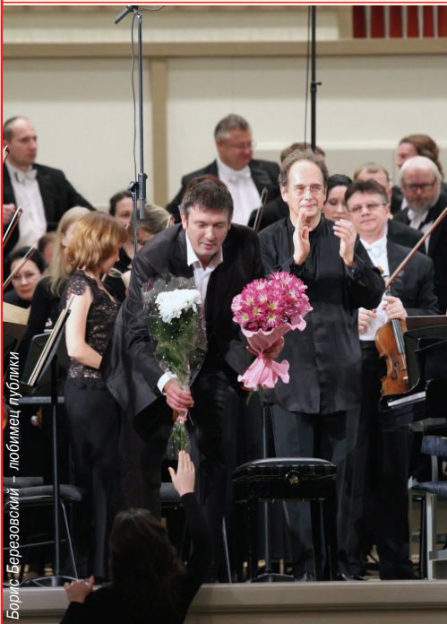
Борис Березовский – любимец публики