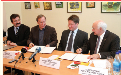
Санкт-Петербургский Дом музыки и Свердловская филармония – партнеры

Фирменный цикл «Дмитрий Хворостовский и друзья» – впервые с участием УАФО.