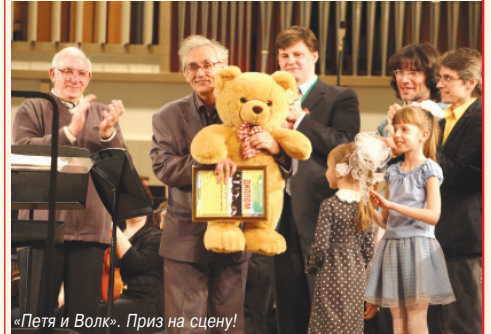
«Петя и Волк». Приз на сцену!