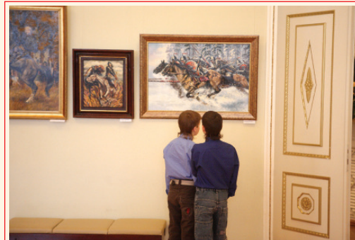
Настоящие мужчины выбирают «Поединок»