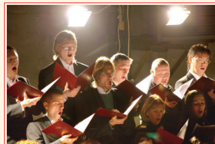
Сольная программа симфонического хора