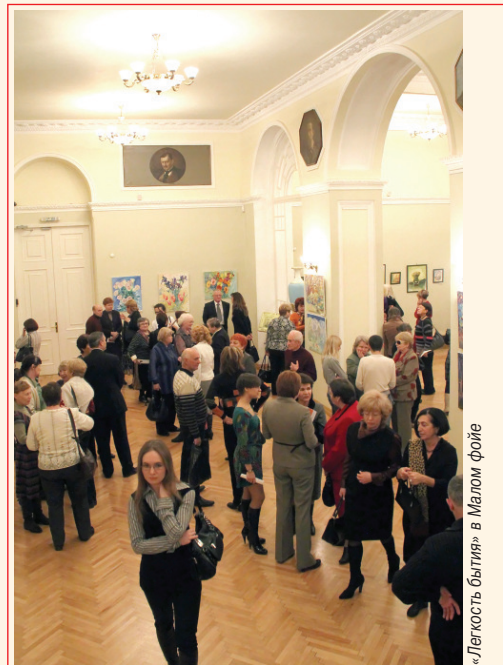
«Легкость бытия» в Малом фойе