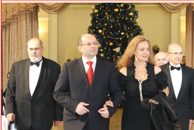
Лучшие традиции Губернаторского бала