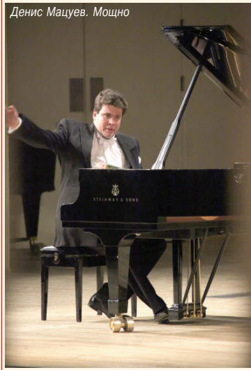
Денис Мацуев. Мощно