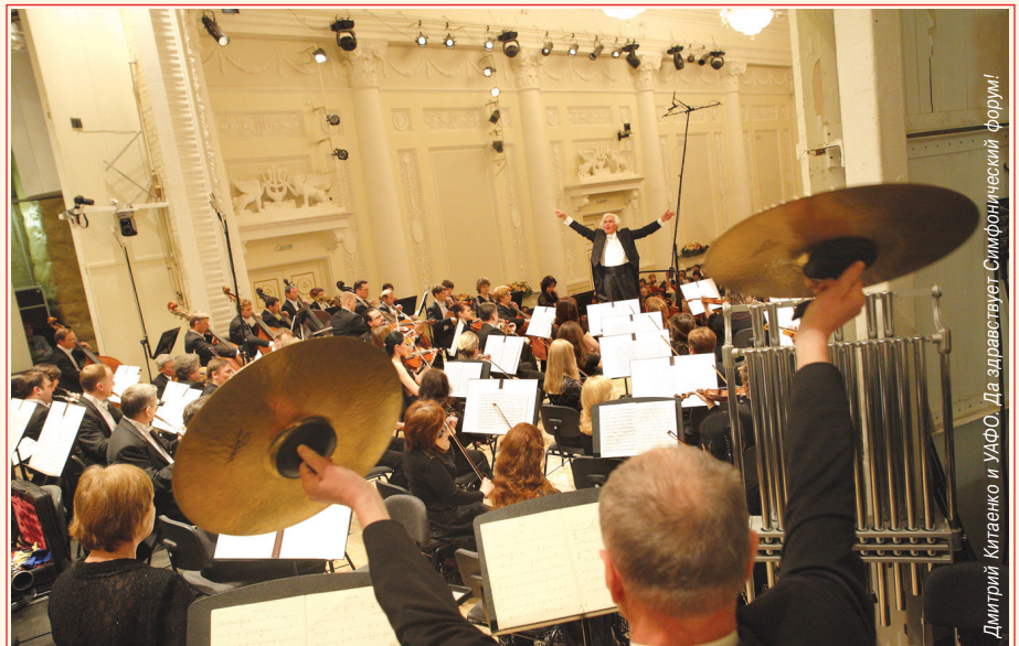
Дмитрий Китаенко и УАФО. Да здравствует Симфонический форум!